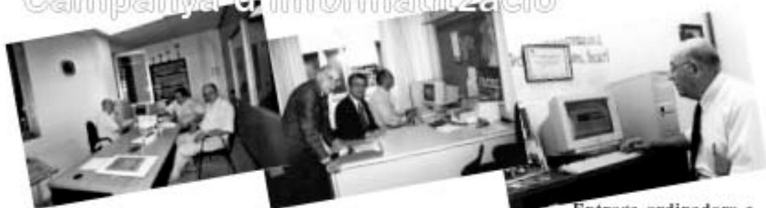
Posada en marxa a l'Associació d'Avis Roses